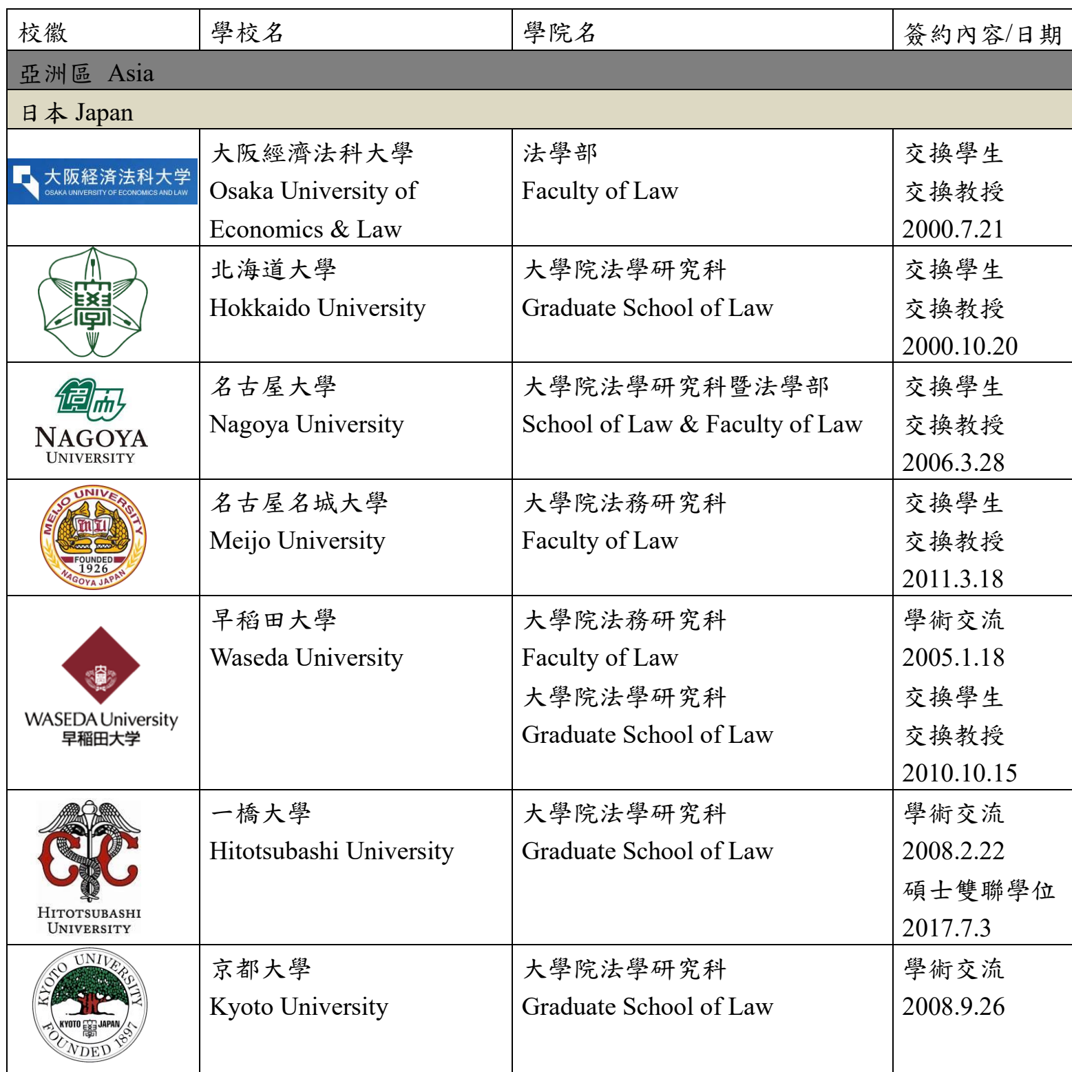
附表一 已簽訂之學術合作計畫 2020.09.04 Updated